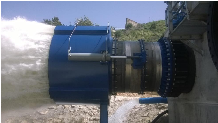
Válvulas tipo Howell - Bunger de 1.600 mm de diámetro para el desagüe de fondo de la presa de Guadalquivir (Junta de Andalucía)

Inagen garantiza todos sus equipos durante el período de un año desde su instalación. Esta garantía cubre cualquier repuesto sin límite de precio e incluye, en territorio nacional, los trabajos, desplazamientos y ayudas de grúa necesarios para la resolución de la incidencia.