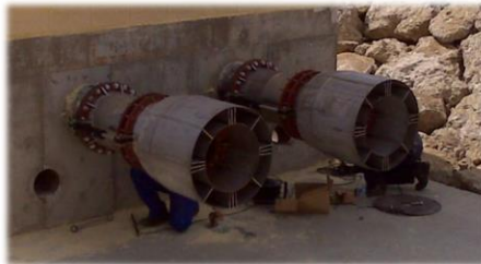
Válvulas tipo Howell - Bungler de 450 mm de diámetro en la balsa de El Rosario (Confederación Hidrográfica del Guadalquivir)