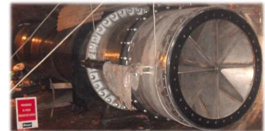
Montaje de válvula tipo Howell - Bunger de 1200 mm de diámetro en el túnel del desagüe intermedio de la presa de Tranco de Beas (Confederación Hidrográfica del Guadalquivir)