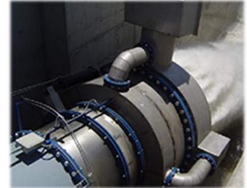
Válvula tipo Howell - Bungler de 1500 mm de diámetro en la presa de Sierra Brava (Confederación Hidrográfica del Guadiana)

Su sencillez en el diseño y el que todos sus elementos móviles se encuentren en el exterior (accesibles) han hecho que sea el tipo de válvula más instalado en sustitución de las válvulas Larner-Johnson, anulares y de aguja como válvulas reguladoras finales de línea.