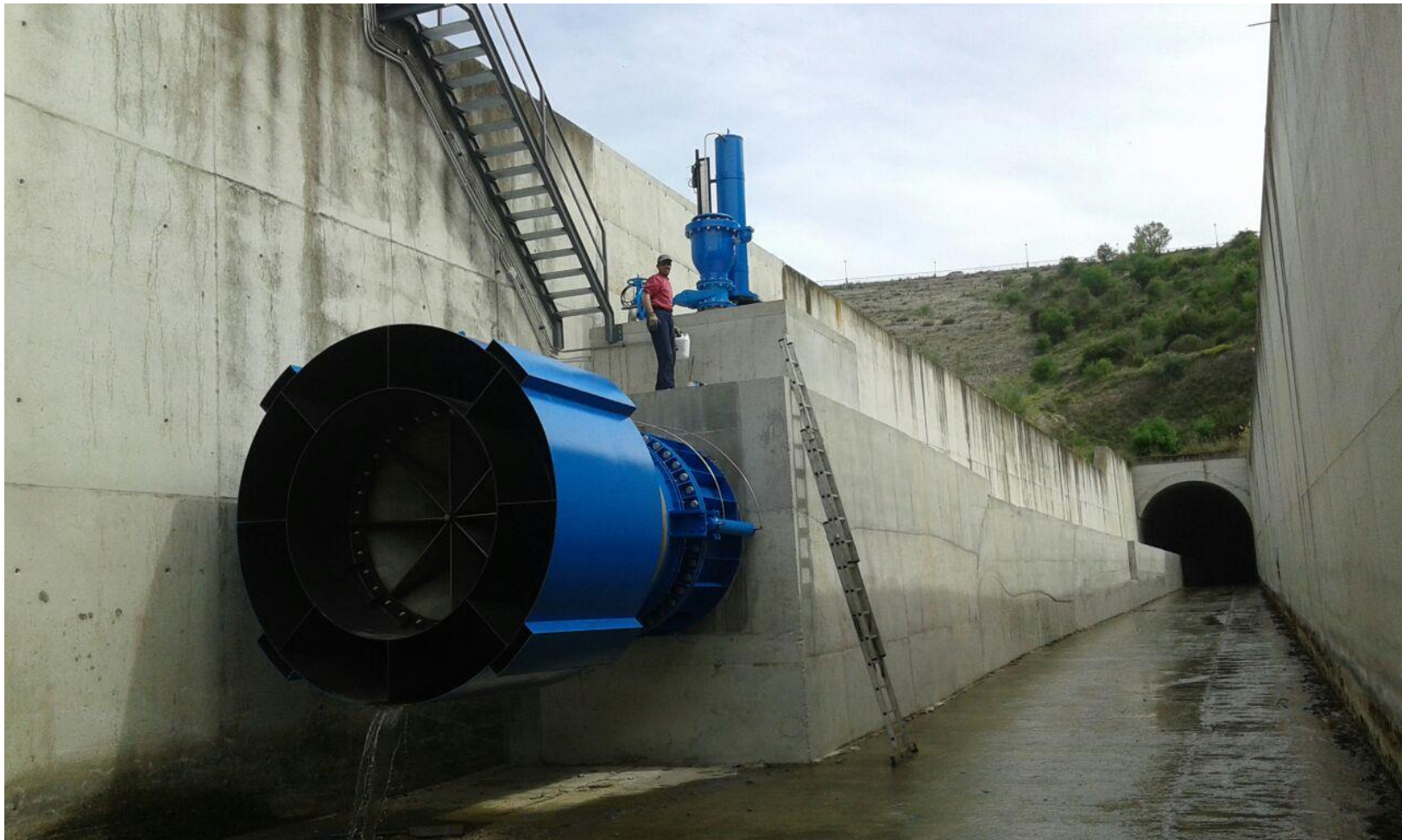
Válvula tipo Howell - Bunger de 1800 mm de diámetro en el desagüe de fondo de la presa de Vadomojón (Confederación Hidrográfica del Guadalquivir)