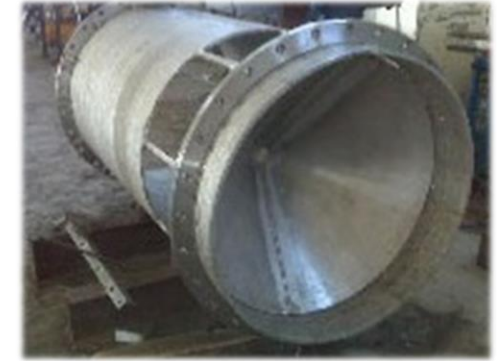
Proceso de fabricación de válvula tipo Howell - Bunger de 1000 mm de diámetro para la Central Hidroeléctrica de Valdetales (Canal de Isabel II - Hidráulica Santillana)