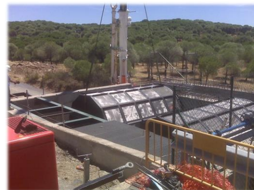
Filtros rotativos instalados en La Subzona Oeste de la Zona regable del Chanza