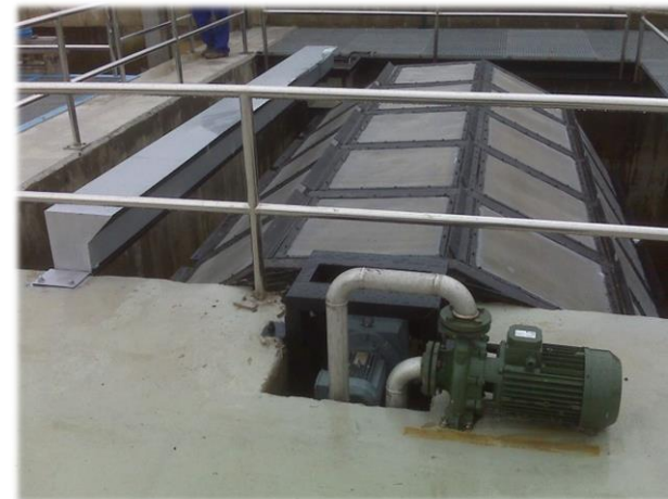
Filtros rotativos instalados en La Subzona Oeste de la Zona regable del Chanza